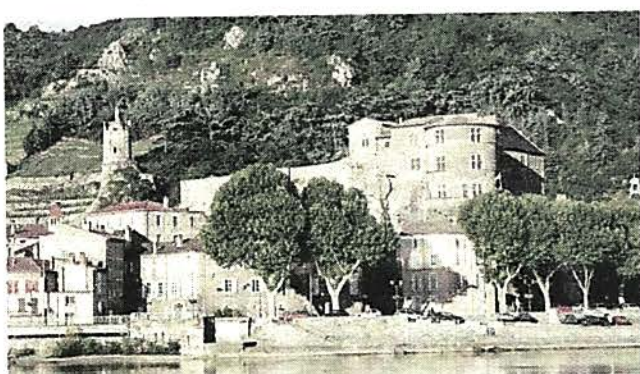
Le château-musée de Tournon, un incontournable des Journées du patrimoine.