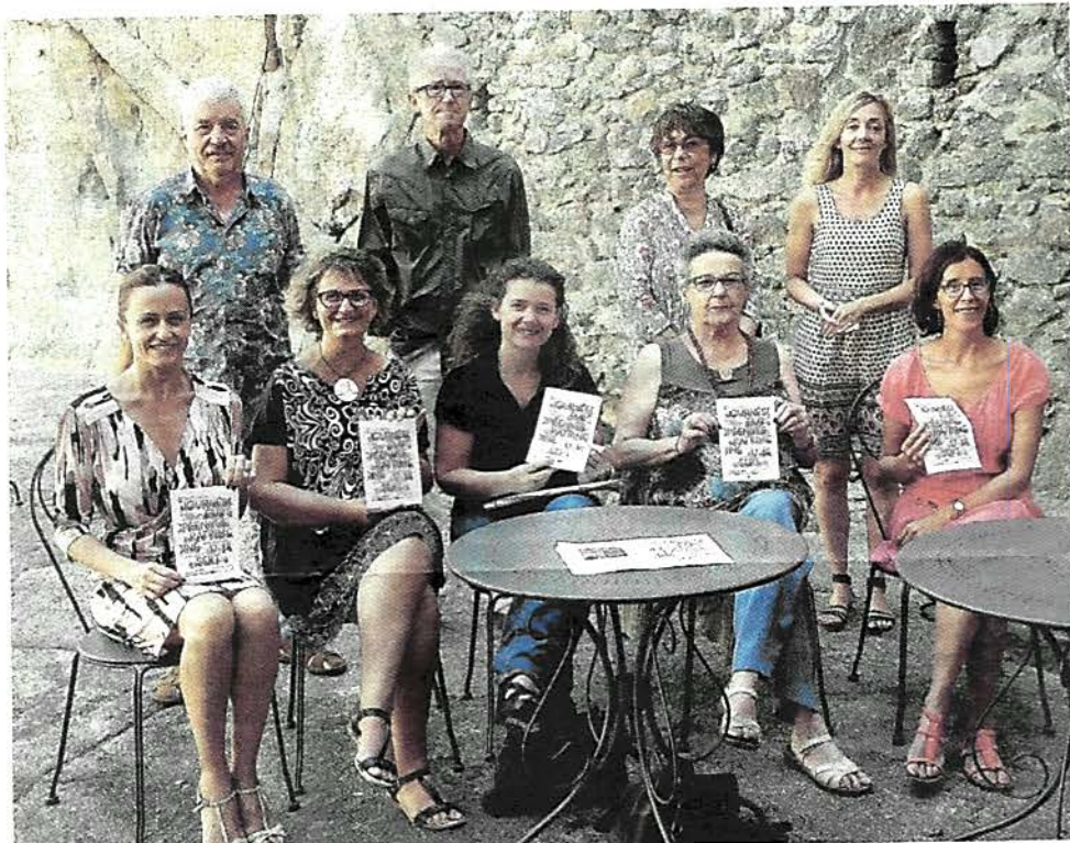
Présentation des journées européennes du patrimoine par les multiples organisateurs de l'Hermitage Tournonais.

Le Château-Musée est bien sûr un incontournable de ces journées : dressé au bord du Rhône, le château de Tournon, monument historique classé, offre un panorama sur le fleuve et les vignobles environnants depuis ses deux terrasses, et sert d'écrit à un Musée de France. Ses collections présentent l'histoire de la navigation et des ponts suspendus, plusieurs salles consacrées aux Beaux-arts et un magnifique triptyque de Giovanni Capassini. L'accès libre à la visite de l'exposition Ghyslain Bertholon