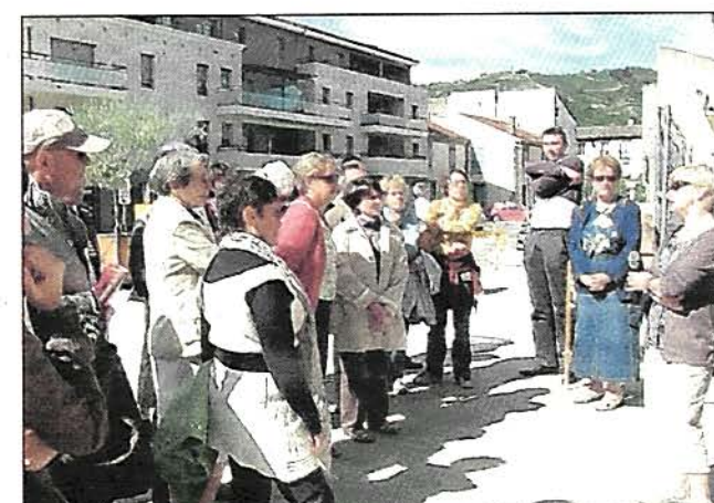
Tain : visite commentée de la ville.