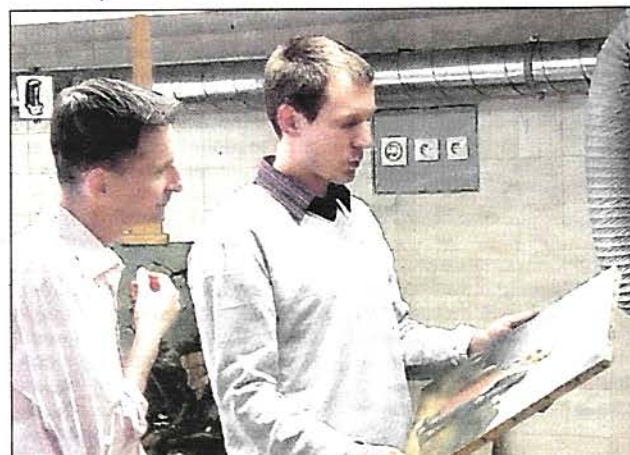
Galerie des tapisseries et expo Gabriel Faure.

« Nous sommes étudiantes en français à Lyon. Nous sommes venues faire la saison des fruits à Tain l'Hermitage. Nous avons beaucoup aimé la visite du château, cela n'existe pas en Chine ! Tout est très intéressant, très différent de la Chine. Nous avons surtout apprécié la chambre d'Hélène de Tournon, et son histoire, une vraie histoire de Princesse ! Les deux villes de Tain et de Tournon sont très agréables et les gens y sont plus sympathiques qu'à Lyon ! »