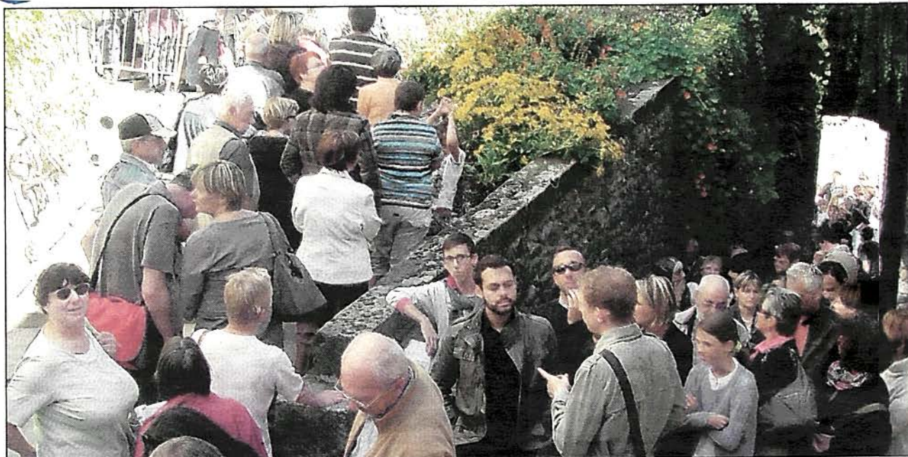
L'imposante file d'attente devant le château qui recevra 1847 personnes durant tout le week-end.

Les autres sites Tournais et Tainois sont dans la même lignée avec 1 847 visiteurs pendant le week-end au château musée de Tournon. Les journées du Patrimoine, un rendez-vous qui semble désormais figurer en bonne place dans l'agenda des amateurs d'art et de culture. Balade entre les deux villes à la découverte de quelques joyaux du patrimoine local.