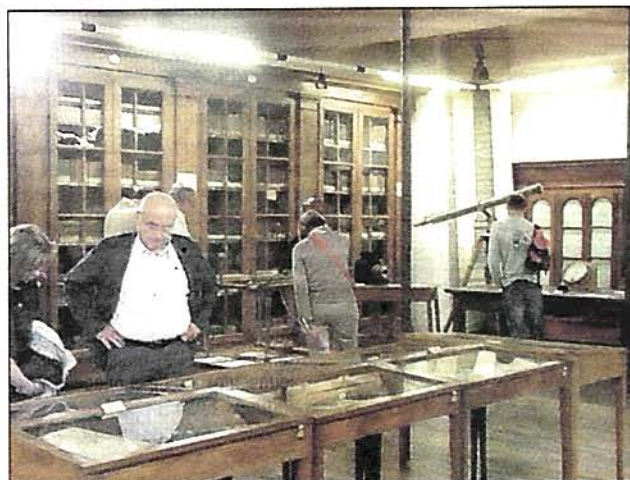
Bibliothèque du lycée Gabriel Faure.