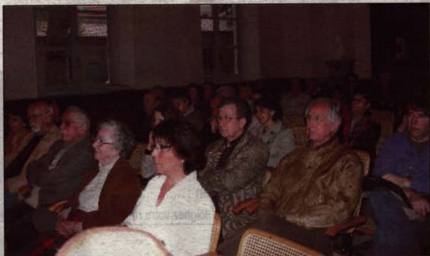
Une nombreuse assistance a assisté à la conférence sur Pierre Paul Sevin.

En 1689, Pierre Paul Sevin quitte Paris pour la province. Sa ville natale en point de chute, l'artiste mène une vie itinérante et continue à réaliser des décors (à Trévoux, Lyon, Villefranche, Dombes par exemple ainsi qu'à la Collégiale Saint-Julien de Tournon). Il meurt le 2 février 1710, probablement de la peste.