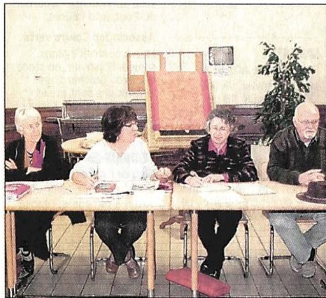
Le bureau de l'association.