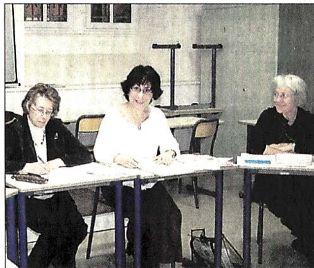
La présidente présente le bilan.

Pour l'année à venir les projets sont nombreux, les portes ouvertes et les visites de toute nature auront bien entendu leur place, d'autres comme l'inventaire de la bibliothèque historique, la restauration de tableaux et une exposition sur Honoré d'Hurfé sont programmés sur les tablettes de l'association qui met toute son énergie à la sauvegarde de l'établissement. □